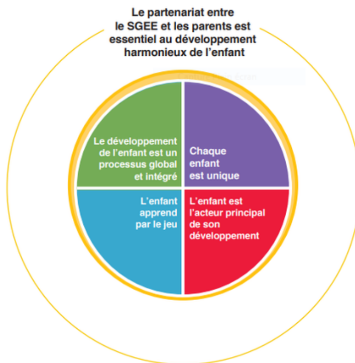
Figure 3 – Les principes de base