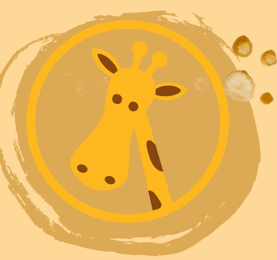
Plate-forme pédagogique Notre histoire

Le Centre de la Petite Enfance de Saint-Lambert Agathe la Girafe détient un permis de cent soixante (160) places. Il est composé de deux installations de quatre-vingts (80) places chacune.